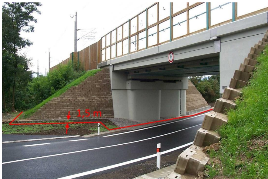
Obr. č. 1 schéma řešení průběhu záborové hranice