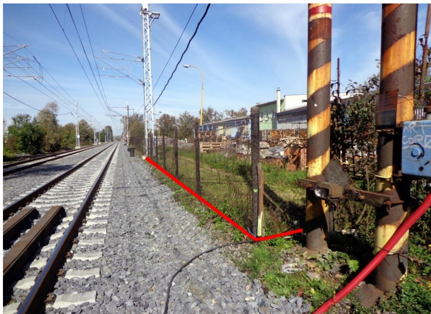
Obr. č. 1 schéma řešení průběhu záborové hranice