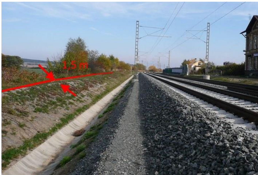
obr. č. 1 schéma řešení průběhu záborové hranice